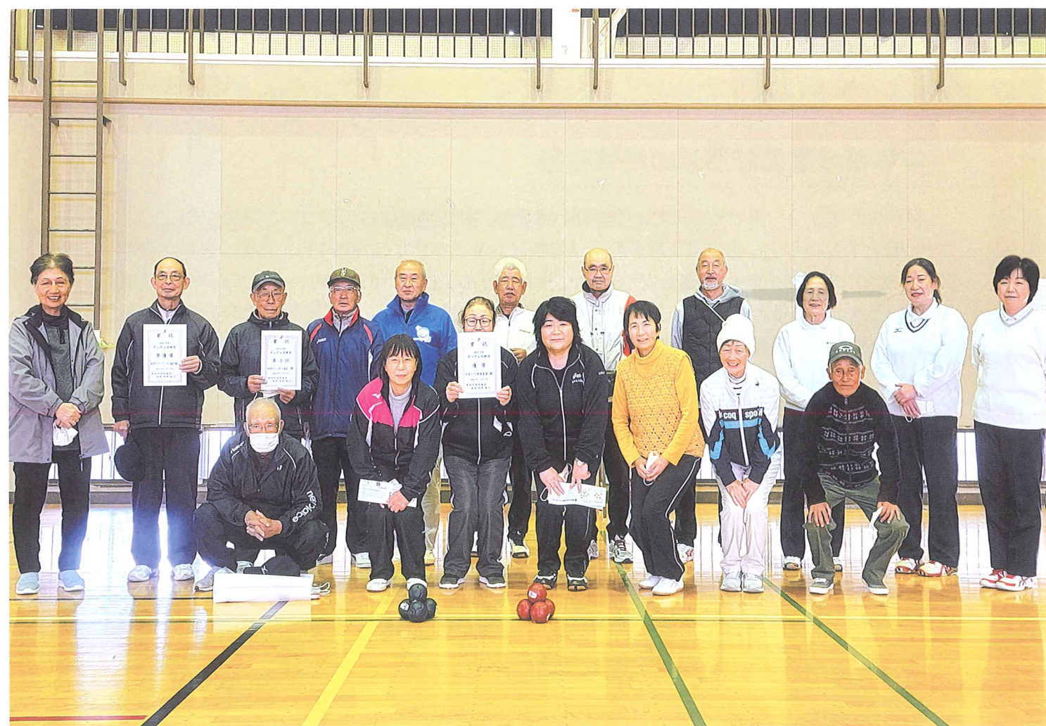
令和4年11月20日「ボッチャ体験会」 (船岡体育館)